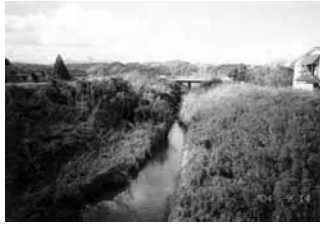
▲河床整備が望まれる山路川

問⑤ 山路川の下流域は小木や小竹や雑草が繁茂しているが、河床整備はどうするのか。 答 現在のところ、竹や雑草の下刈りくらいしか出来ない。計画的な改良を県に訴えている。