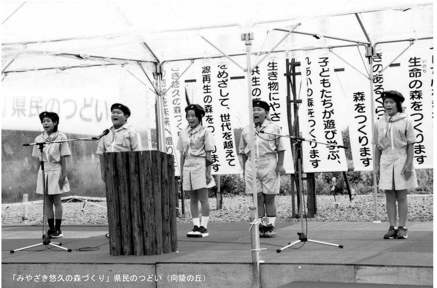
「みやざき悠久の森づくり」県民のつどい（向陵の丘）