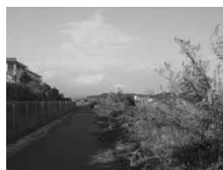
▲雑草が繁茂する市道