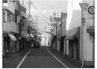
▲活性化が求められる中心市街地