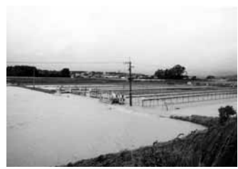
▲台風16号によって冠水したハウス施設