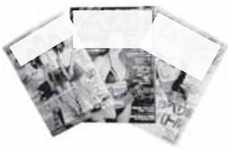
▲氾濫する性情報誌

答 緑と、カラーピーマン、ゴーヤ、ニラ粉末、胡瓜スライスなどの製品開発等を業者からの要望で改善を重ね、よ