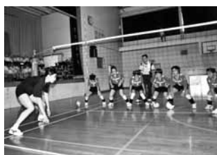
▲全日本女子選手からバレーボールの指導を受ける子どもたち