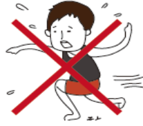
외부 피난은 신중하게