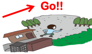
해수면보다 높고 넓은 공터로 피난