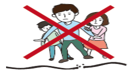
끊어진 전선 주의