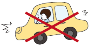
급정차 하지 않기