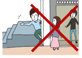
엘리베이터 타지 않기