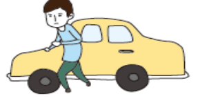
차에서 내려 신속하게 피난

여진이나 정전이 발생해도 동요하지 말 것. 흔들림이 멈추면 임시피난소로 이동.