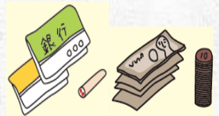
현금, 카드 등