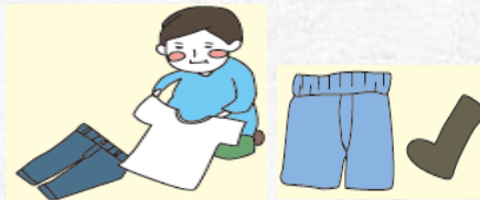
옷, 속옷, 양말 등