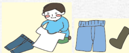
衣服・內衣・襪子