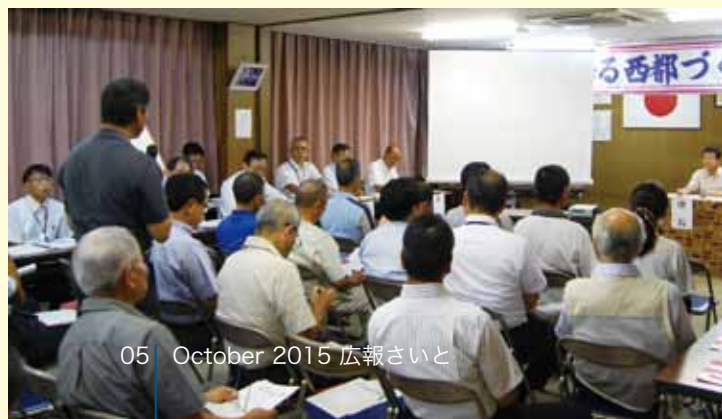
05 October 2015 広報さいと

(総合政策課長) 交通空白地域を順次解消しようということで、コミュニティバスがない地域では、タクシー型または予約制（デマンド型）形態での新しい地域へのバスの導入を平成30年度をめどに考えている。