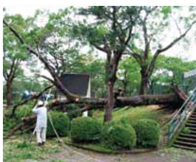
15号の倒木被害(西都原運動公園)

いづどこで起きるか分からない災害。いざという時のために、それに対する準備と心掛けの重要さを改めて感じます。(ひ)