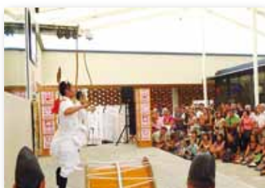
ミラノで披露された銀鏡神楽