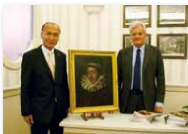
伊東マンショの肖像画を鑑賞