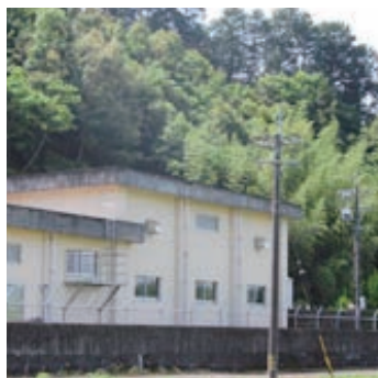
東原配水系・牛掛浄水場