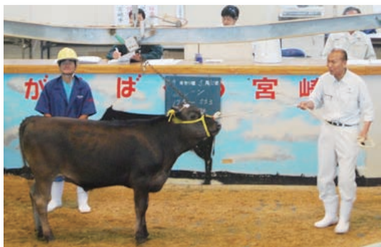
セリに出場したシンボル牛の第一子