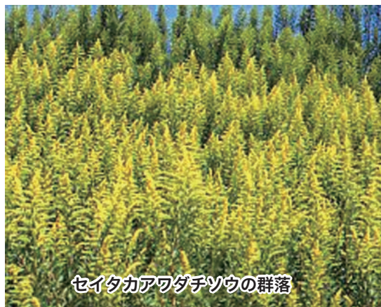
セイタカアワダチソウの群落