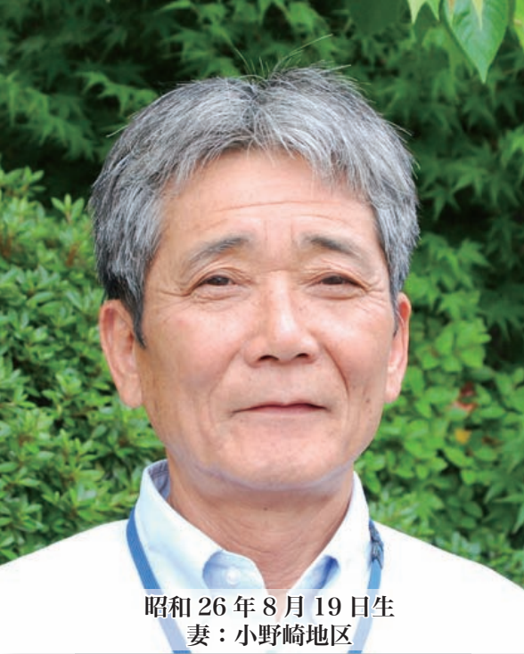
昭和26年8月19日生 妻：小野崎地区

4月から市観光協会の事務局長に就任。 西都の『観光』はもちろん、西都の『人』をPRします。