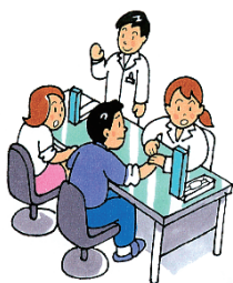
第1期特定健診・特定保健指導実施状況

このような状況を踏まえて、これまでの保健指導対象者（メタボ該当者・予備群）に加え、高血圧・脂質異常・腎臓病の重症化予防についても積極的に取り組んでいきます。