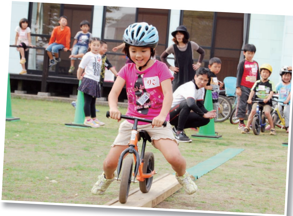
▲第2回ウィーラーズスクール in 宮崎（5月9日） 西都市児童館で開催された自転車教室。36人の児童が、楽しみながら自転車の乗り方を学びました。