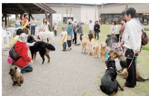
大きくて優しいワンちゃんたちでした

でもうちの小さなトイプードルは、大型犬に囲まれてブルブル…。ほろ苦いデビューとなりました。(あ)