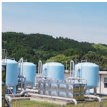
高砂水系・高砂浄水場

※高砂水系は第 1 水源と第 2 水源の平均値。東原配水系は牛掛水源と串木水源の平均値。