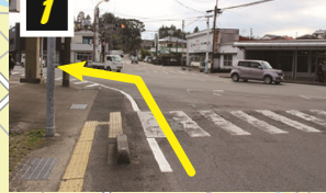
▲三笠交差点を左折