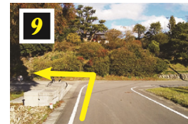
▲一本杉がある曲がり角を左折