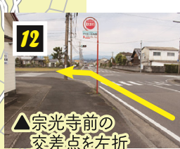
▲宗光寺前の交差点を左折