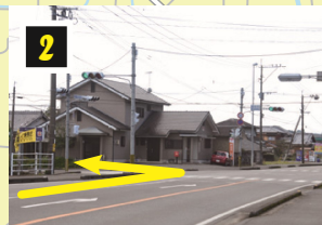
▲宮の下交差点を左折