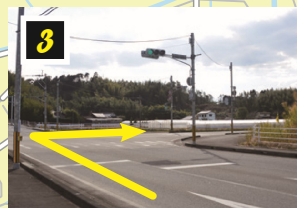
▲交差点を右折し県道18号線へ