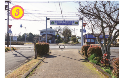
▲春には桜の花びら舞うサイクリングロード