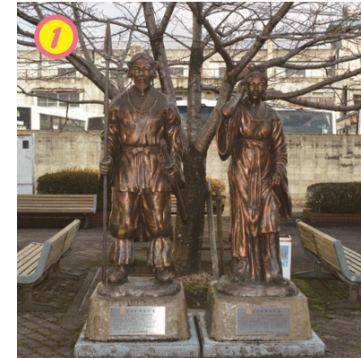
▲ニギノミコ、コノハナサクヤヒメ像に見送られて出発