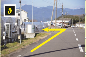
▲ハウスとハウスの間の道へ左折