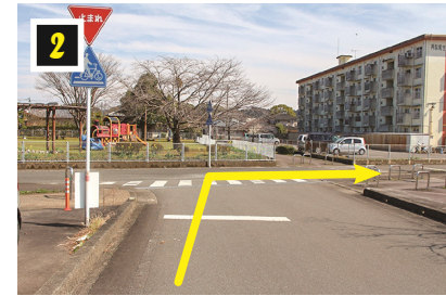
▲一時停止を右折しサイクリングロードへ