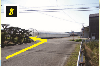
▲ハウス手前を左折