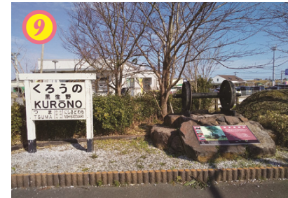
▲昭和59年11月に廃線となった国鉄妻線跡