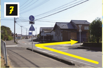
▲左に西都市消防団が見えたら横断して小道へ