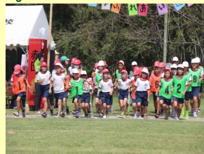
全員主役の運動会