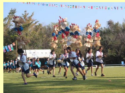
子ども臼太鼓踊り