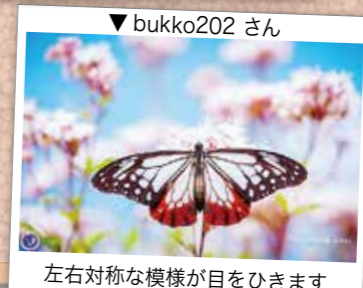
左右対称な模様が目をひきます