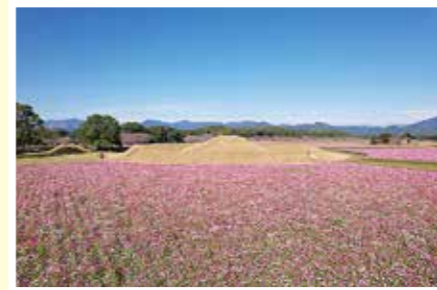
ドローンで撮影した西都原のコスモスです

これから地域貢献に取り組みながら、西都市の良いところをたくさんアピールしていきたいと思っています。西都市の地域おこし協力隊は、現在4人で活動しております。私たちが取材などに現れた際には、気軽に声をかけていただけるとうれしいです。今後ともよろしくお願いたします。