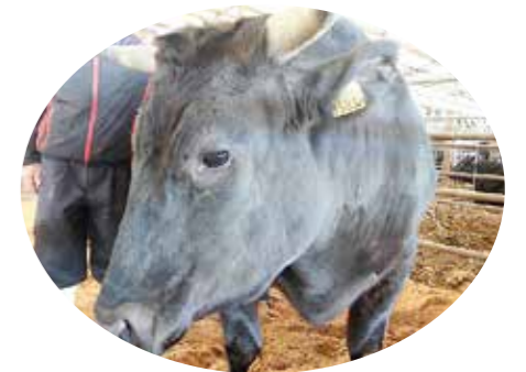
▲シンボル牛「さいと号」

平成22年(2010年)に発生した口蹄疫終息後、本市畜産業の復興のためにいただいた義援金をもとに設立された「西都市口蹄疫復興シンボル牛運営協議会」がその役割を終えるにあたり、次世代の畜産業の担い手育成を行っている宮崎県立高鍋農業高等学校の生徒たちへ繁殖メス牛(子牛)を贈呈しました。同協議会はいただいた義援金を活用して復興の象徴となるシンボル牛1頭を購入し、生まれた子牛をセリ市に出すなどの活動を続けており、今回の贈呈牛は同協議会で購入したものです。