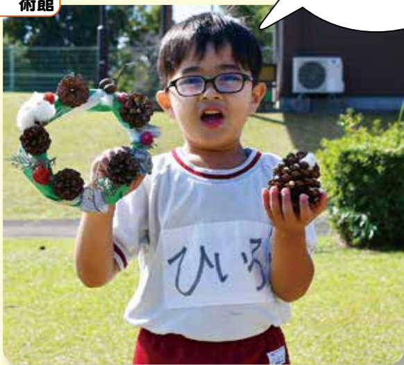
いにひいる ちゃん (5歳) 作品「クリスマスプレゼント」 清水保育園

いつもお仕事をがんばっている人たちのために作ったよ!! プレゼント喜んでくれるといいな~