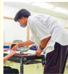
スマートフォンの操作方法などを教えています