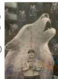
木下 いずみ『孤高の声』 ※九州大会推薦作品