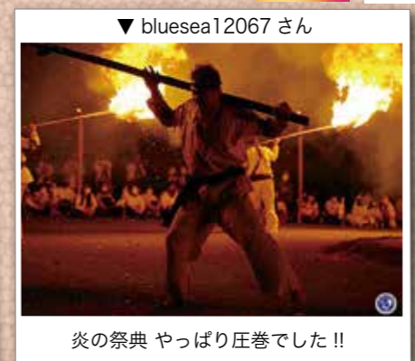
炎の祭典 やっぱり圧巻でした!!