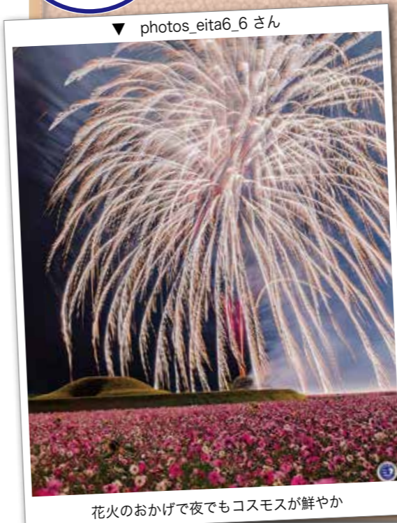
花火のおかげで夜でもコスモスが鮮やか