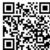
申込み二次元コード