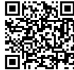
市立図書館 ホームページ

日時：12月14日(日) 午前10時～(予定) 内容については、決定後、市立図書館ホームページなどでお知らせします。