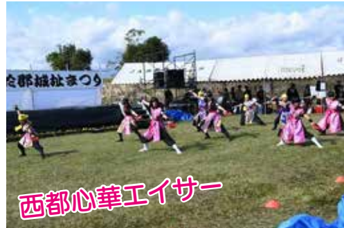
西都心華エイサー