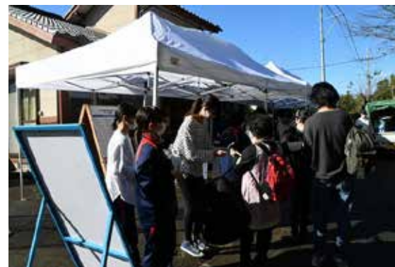
▲感染対策として検温所を設置しました! たくさんの学生ボランティアが参加!!