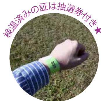
検温済みの証は抽選券付き★