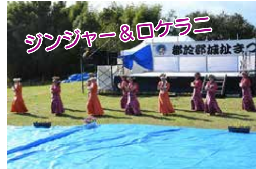
ジンジャー&ロケラニ