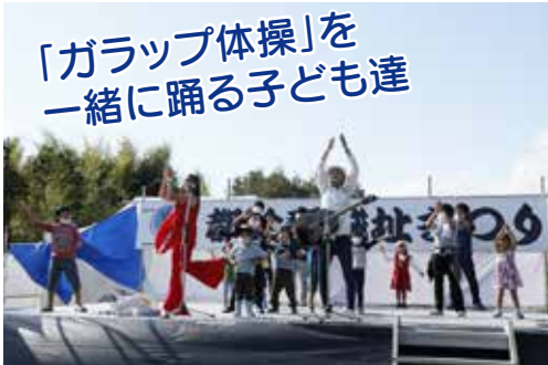
「ガラップ体操」を一緒に踊る子ども達