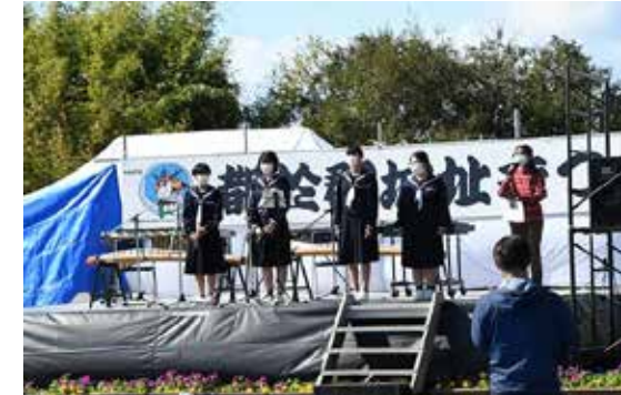
▲楽器演奏(都於郡中学校) 今年はステージ発表だけでなく、たくさんの生徒がボランティア参加してくれました