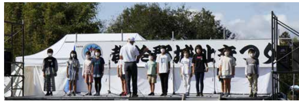
▲今年は「合唱部」ができたとのことで、初披露でした!