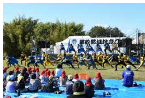
▲都於郡小学校の生徒たちによる学習発表会。3年ぶりともなると、子どもたちの顔ぶれも変わっていますね!! 久しぶりの都於郡城でのステージ発表はどうだったかな?