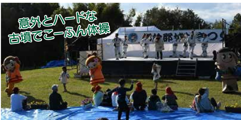
意外とハードな古墳でこーぶん体操