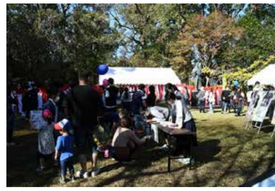
▲佐土原高校のゲームコーナーは生徒の手作り!!子ども大人まで大人気で大行列!!