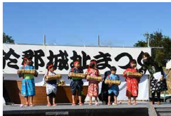
▲岩爪豊年俵踊り(都於郡保育所)