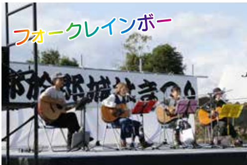
フォークレインボー