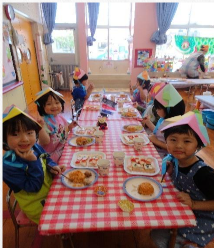
こいのぼりバイキングの様子です。