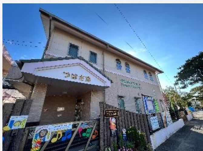
▲ 地域子育て支援センター