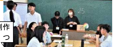
交流授業で一緒に制作した「浮世絵」の1つ