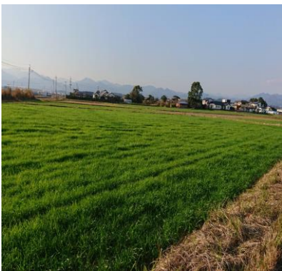
西都インターチェンジに近い赤池地区

答 そのことについては、医療センターに確認を行っていないのでわからない。一緒に説明会を開くということについては建設場所についての市の方針、市が主体となつて開いた。