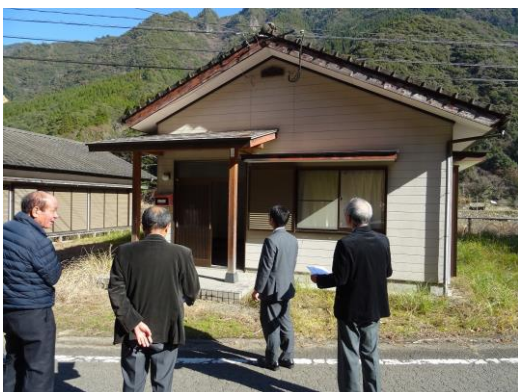
銀鏡中学校及び銀上小学職員住宅 現地調査の様子

これらの議案9件については、種々質疑の後、別段異議なく、採決の結果、全会一致をもって原案のとおり可決すべきものと決しました。