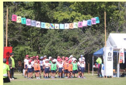
全員主役の運動会