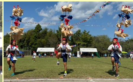
子ども臼太鼓踊り