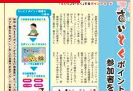
地域ポイント制度「さいとくカード」の運用が始まる