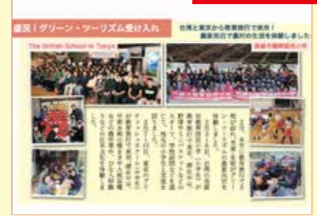
市グリーン・ツーリズム研究会が行う農家民泊の受け入れが年間1000人を超える