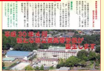
新高校の学科やコースが決まり、校名が「宮崎県立妻高等学校」となることが決定