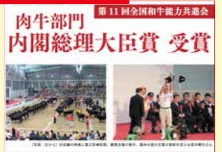
第11回全国和牛能力共進会で、宮崎県が肉牛部門で内閣総理大臣賞を受賞