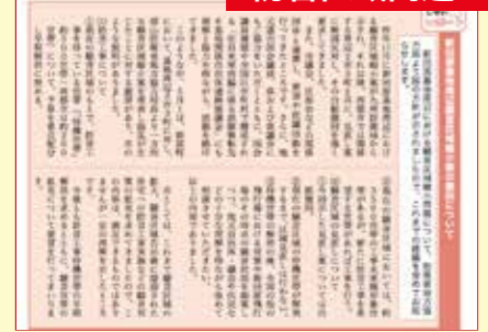
市内で騒音調査などを実施し、防衛省が提案していた防音区域縮小案の白紙撤回が決定