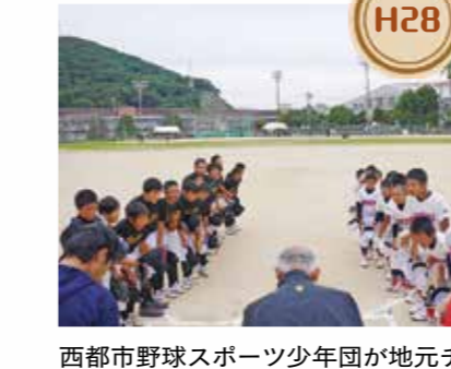
H28 西都市野球スポーツ少年団が地元チームと教育交流を行いました。