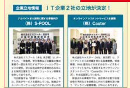
市内で初めてのIT企業の立地をはじめ、誘致企業の新工場設置などが進む