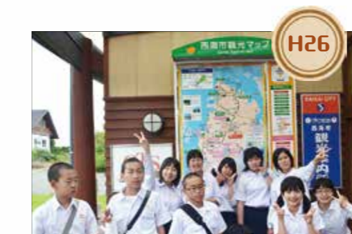
H26 銀鏡中学校生が修学旅行で西海市を訪れました。