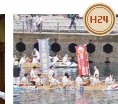
H24 「大瀬戸ペーロン大会」へ西都市チームとして参加しました。