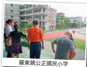
羅東鎮公正國民小学

ます。入団に際しては、学業との両立が条件となっています。主な活動は普段の生活に必要な技術の習得、地域での積極的なボランティア活動などで、海外のボーイスカウトとの国際交流活動も実施されています。これらの実績が評価され、東光國民中学はボーイスカウト優秀学校を受賞しています。