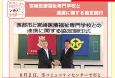
宮崎医療福祉専門学校をはじめ、児湯広域森林組合などと各種連携協定を締結