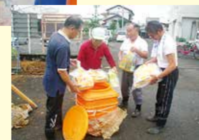
ふるさと祭りの様子(左)

郡十五夜踊りなどが披露されました。また農産物が当たる抽選会やせんぐまき、体育館ではタイムカプセルの公開絵画・写真などの作品展示やバザーを実施。ジャンボテントでは綿菓子や寿司の振る舞いなどもあり、多くの来場者でにぎわいました。現在、三納地域づくり協議会では、将来の三納のあるべき姿を描く「地域づくりプラン」を、住民アンケートも実施しながら計画を策定しています。