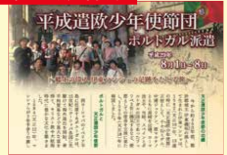
3年ぶりの平成遣欧少年使節が実施され、都於郡中学校の生徒2人がポルトガルを視察