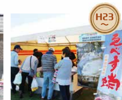
H23 西海市の皆さんに「さいとふるさと産業まつり」へ毎年参加していただき、同市の海の幸と山の幸を販売していただいています。※今年度は台風のため中止となりました。