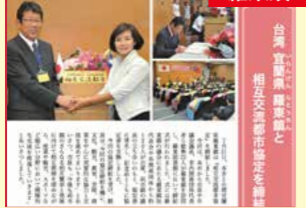
台湾の宜蘭県羅東鎮と相互交流友好協定を締結