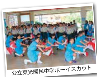
公立東光國民中学ボーイスカウト

台湾ではボーイスカウト活動が非常に盛んで、多くの子どもたちが入団しています。羅東鎮にある公立東光國民中学のボーイスカウトは70年以上の長い歴史があり、300人以上の団員がい