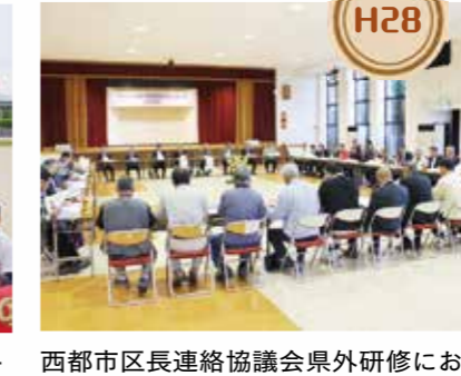
H28 西都市区長連絡協議会県外研修において、西海市を訪問し、地元の区長さん方と意見交換会を行いながら、交流を深めました。