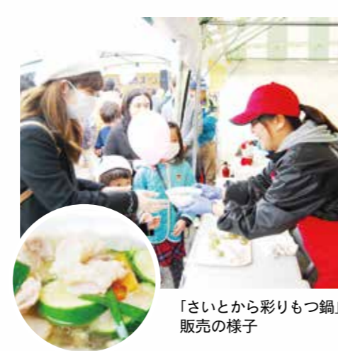
「さいとから彩りもつ鍋」販売の様子

温まったよ」とご好評をいただきました。また、その他、西都産のお茶や鮎の塩焼き、牛肉や焼き菓子などの地場産品を販売し、地元の方々と交流を図りながら本市のPRをしてきました。当日はあいにくの曇り空で、肌寒い一日でしたが、会場は多くの来場者でにぎわいました。