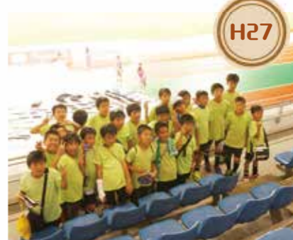
H27 妻南サッカースポーツ少年団が西海市で教育交流を行いました。