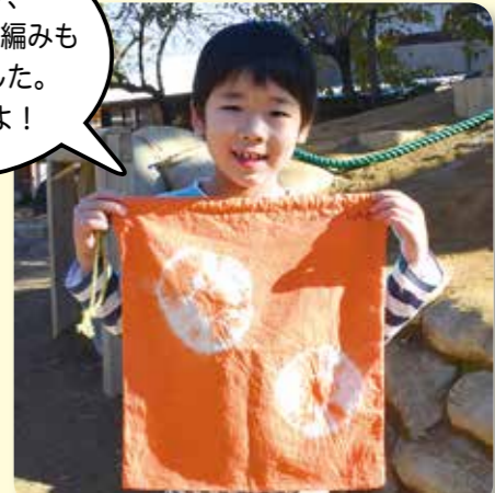
ひだか しょうとくん あいいく幼稚園・6歳 作品「お道具ぶくろ」