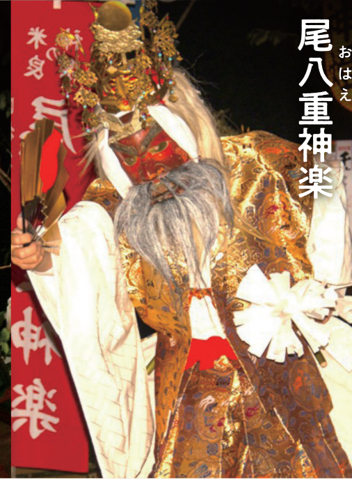
おはえ 尾八重神楽