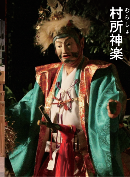
むらしよ 村所神楽