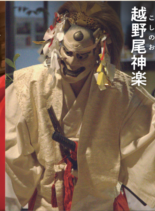
こしのお 越野尾神楽