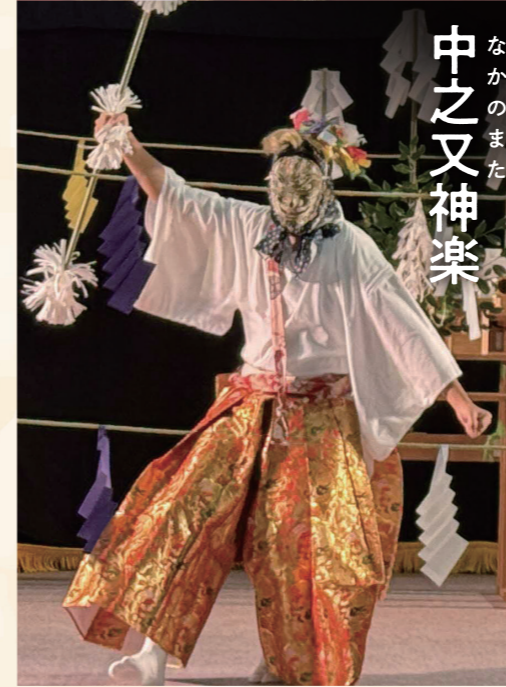
なかのまた 中之又神楽