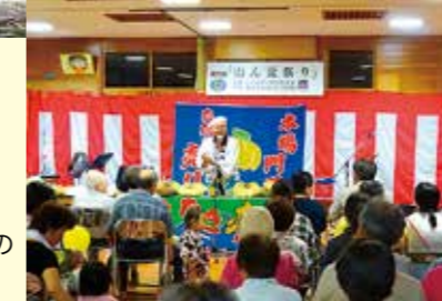
山盆まつりの様子(右)

人口減少と高齢化は止めることは出来ませんが、その中でも地域づくりに対する意識は強く、環境整備など年間を通して協力し合い行っています。どうぞ皆さま、東米良に足を運んでみませんか?東米良は決して忘れ去られないよう、地域づくりを通じてここに住む人々がしつかりと生きていくと頑張っています。