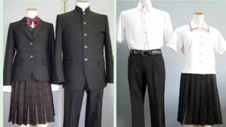
(新) 高校 冬服

校歌、校訓は引き続き(現)妻高校のものが使用されます。校章、制服は(新)妻高校では新しくなります。