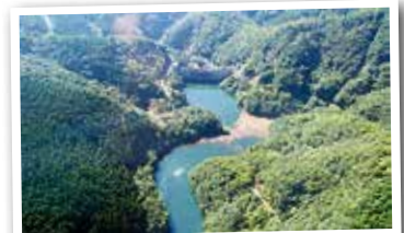
上空から撮影した「長谷ダム」

負傷者の吊り上げや山火事の消火訓練など、年数回行われている県防災ヘリ「あおぞら」と市消防署の合同訓練。この合同訓練が10月10日に行われたので、取材を兼ねて参加させていただきました。間近で見る空からの放水の迫りにビックリ & 撮影訓練のためヘリに搭乗させてもらい、普段撮れない上空からの景色を撮影。地上と空、両方で特別な体験をさせてもらいました。(ひ)