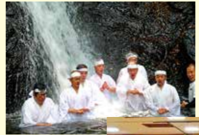
水車滝での滝行の様子(左)

東米良地区は、広い山間地に集落が点在し高齢化も進んでおり、一極集中の活動ができません。現在、東部地区と西部地区にわかれて連携を取りながら活動をしています。東部地区は、尾八重神楽、中尾棒踊などの伝統文化の継承、有楽椿まつり、笄掘り体験などのイベントがあります。有楽椿まつりについては、道路崩壊のため、2年間出来ませんでしたが、本年度は出来る予定ですのでぜひ、多くの方に来ていただければ幸いです。