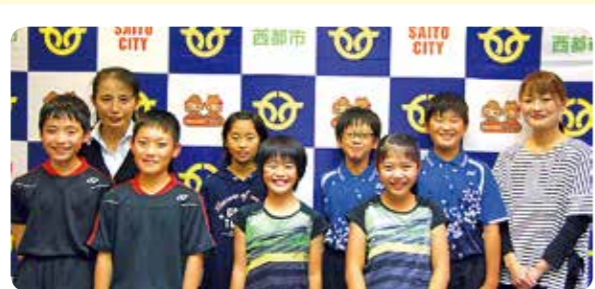
全九州小学生バドミントン選手権大会に出場 妻北小・妻南小バドミントン選手の皆さん

今回は活躍された人が多かったため、『西都の人WIDE』として紹介させていただきます。