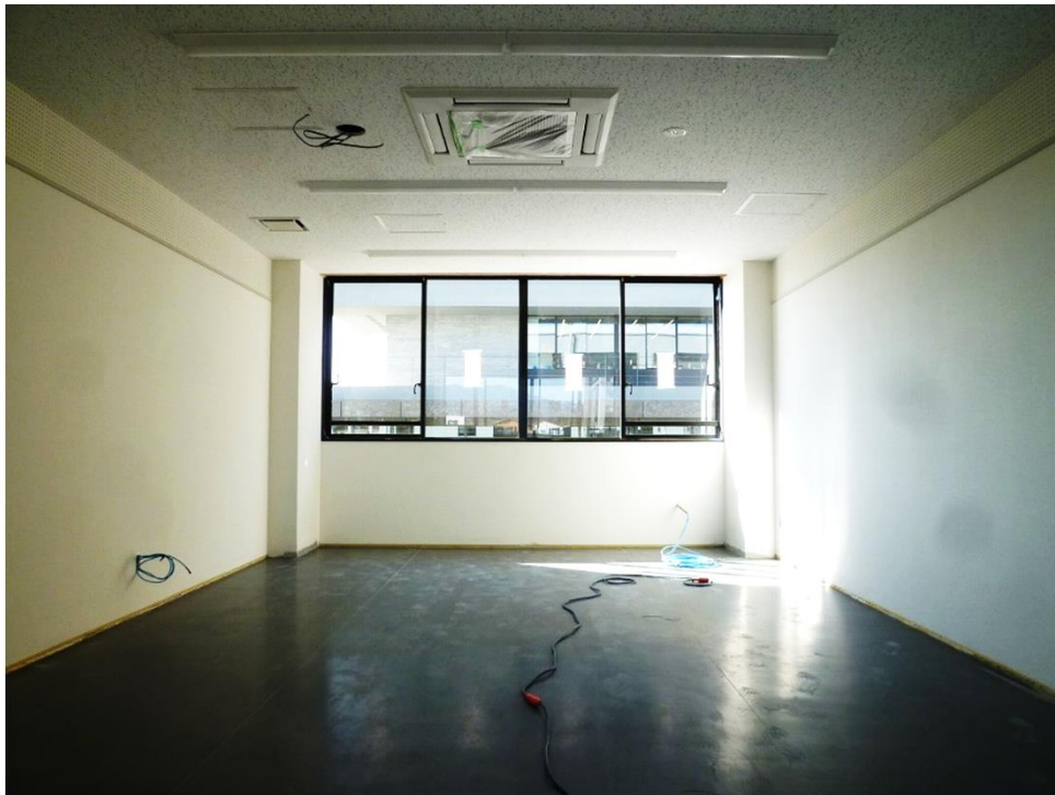
内装工事 (2階 事務室)