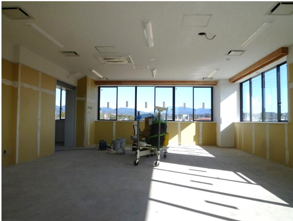
内装工事 (3階 学習室)