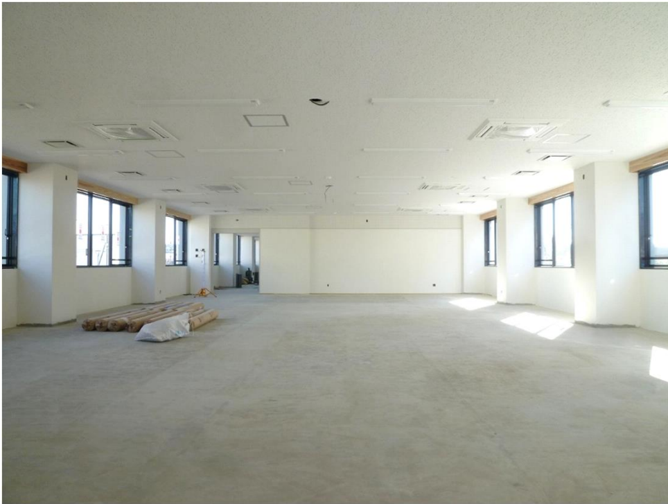
内装工事 (2階 中会議室)