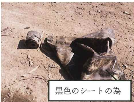
黒色のシートの為

※肥料袋はPO・PE製のもの（麻袋のように編み込まれている素材のものは収集できません。）