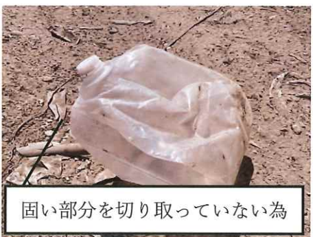
固い部分を切り取っていない為