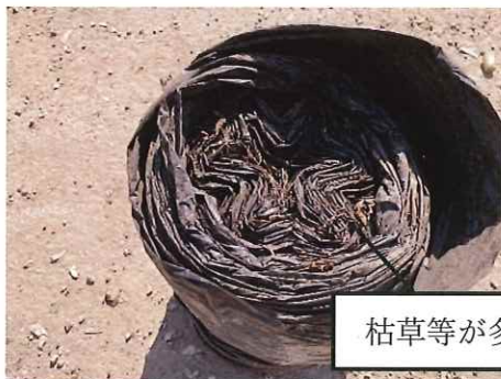
枯草等が多量に付いている為