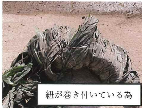
紐が巻き付いている為