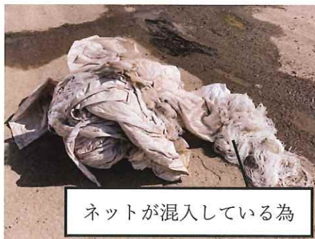
ネットが混入している為