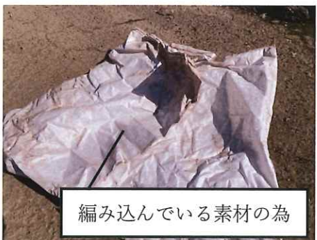
編み込んでいる素材の為