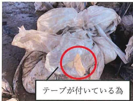
テープが付いている為