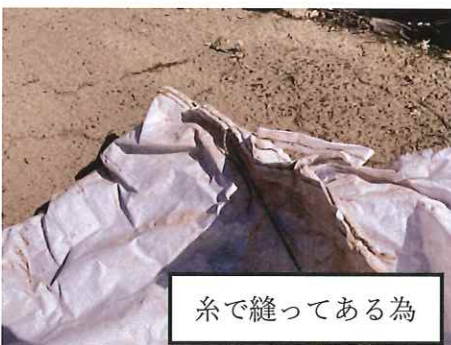
糸で縫ってある為